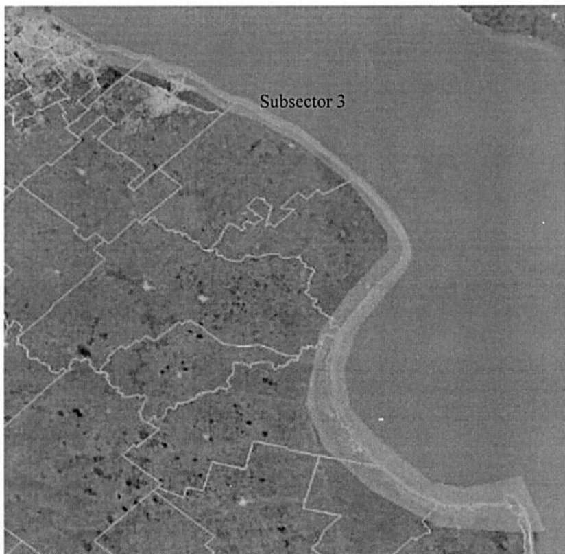
Imagen 3. Subsector 3: Tramo Avellaneda - Pta. Rasa